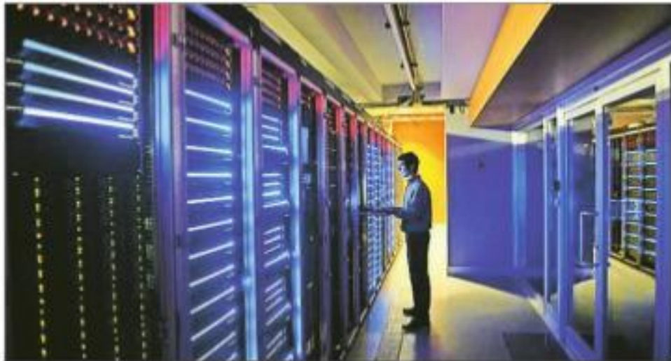
Computing capacity is among the most important elements of building a large AI system

ing will be done both within the government and through a public-private partnership model, highlighting New Delhi's intention to reap dividends of the impending AI boom which it envisions will be a crucial economic driver. Last month, Prime Minister Narendra Modi announced the AI Mission and said its aim was to establish the computing powers of AI within the country. This, he said, will provide better services to startups and entrepreneurs and also promote AI applications in the sectors of agriculture, healthcare and education. In total, the country is looking to build a compute capacity of anywhere between 10,000 GPUs (graphic processing units) and 30,000 GPUs under the PPP model, and an additional 1,000-2,000 GPUs through the